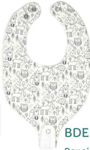
Bdent1 Bavoir dent. Harmonieux Minimum Qty : 1