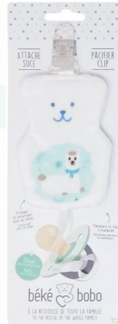
AS03 Attaché suce Lama Minimum Qty : 1