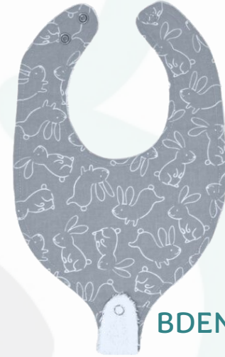
Bdent2 Bavoir dent. Enjoué Minimum Qty : 1