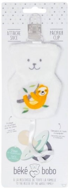
AS01 Attaché suce Paresseux Minimum Qty : 1