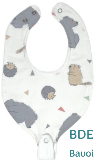
Bdent4 Bavoir dent. Douillet Minimum Qty : 1